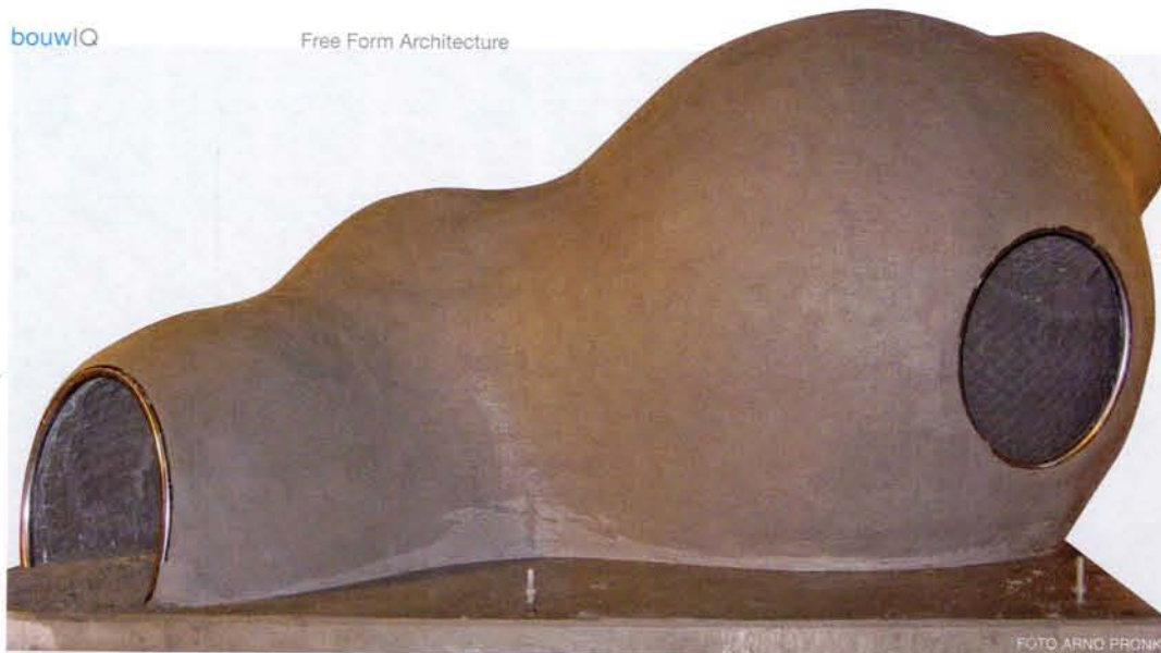
Ballonnen met kabelnetten als mal. Na het aanbrengen van het spuitbeton ontstaat de blob.

Er wordt op dit moment in Eindhoven een instituut opgericht dat een symbiose en synergie nastreeft tussen de verschillende kunsten die gebruik maken van de allernieuwste technologie. In dat kader wordt de herbouw van het Philips-paviljoen overwogen. We hebben gestudeerd op manieren om het goedkoper uit te voeren dan wat het zou kosten wanneer de toenmalige bouwmethode nu zou worden gebruikt.